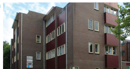
Medi-Mere Haven (Zorgplein Almere) Kerkstraat 90 1354 AC Almere Haven