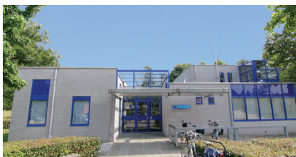
Medi-Mere Buiten Haasweg 9 1338 AW Almere Buiten