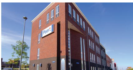
Medi-Mere Poort (Poort Kliniek) Beneluxlaan 573 1363 BJ Almere Poort