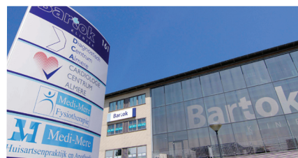
Medi-Mere Stad (Bartok Kliniek) Bartokweg 161 1311 ZX Almere Stad