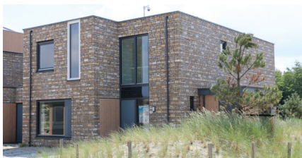
Medi-Mere Duin (nu nog gast in Poort Kliniek)